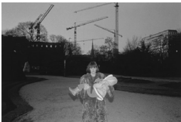
SEIICHI FURUYA, Dezember 1983: Stadtpark Wien. In: Mémoires 1983, Salzburg 2006, S. 307.

Damit wird deutlich, dass die skizzierten Bedeutungen von Authentizität und Autorschaft nur einer westlichen Konzeption zukommen. Für einen asiatischen Autor scheinen weder Selbstvergewisserung noch deren Gewährleistung noch der Telos eines finalen Werkes entscheidend; vielmehr steht Aufrichtigkeit im Kontext eines Weges, der gewissermaßen von selbst, auf natürliche Weise Literatur produziert. Es erscheint mir daher angebracht, das Tagebuch nicht als eine Leitform von Furuyas fotografischer Arbeit zu sehen, sondern eher als eine Art von entsprechendem – wohl zutiefst »westlichem« – Pendant, das eine Beziehung nur in einer differenzierenden Gegenüberstellung herzustellen vermag. Allerdings scheint mir die Grenze dieser Beziehung nicht zwischen den Äußerungen eines östlichen Fotografen auf der einen Seite und seiner westlichen Frau auf der anderen zu verlaufen, sondern bereits in Furuyas Arbeit selbst angelegt, der Japan ja schon vor Jahrzehnten verlassen hat. Im Spannungsfeld der Differenzen manifestiert sich auch jenes Übersetzungsproblem, das Herta Wolf als ein Leitthema von Furuyas Lebensarbeit (mit ihren vielen Ortsveränderungen, den Sprachbarrieren und von Verlust geprägten Zäsuren) ansprach.