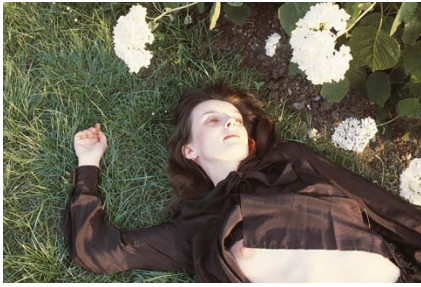
Farbfoto SEIICHI FURUYA, Juli 1983: Wien, Schlosspark Schönbrunn. In: Mémoires 1983, Salzburg 2006, S. 174.

der formalen Buchgestaltung eine größtmögliche Gleichberechtigung von Texten und Bildern angestrebt, die so etwas wie eine faire Konfrontation ermöglicht.