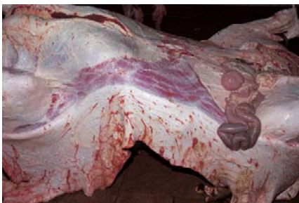
Farbfoto SEIICHI FURUYA, Juli 1983: Streitdorf. In: Mémoires 1983, Salzburg 2006, S. 208.

Die beschriebene Art der Zusammenstellung seiner Fotografien mit ihren Notizen gewinnt somit eine andere Tragweite: Wesentlich scheint nicht das Gegeneinanderstellen zweier (gesonderter, aber in sich konsistenter) Autorenperspektiven oder zweier (jeweils auf verschiedene Art authentizitätsversprechender) Medien als vielmehr ein Weg des Näherbringens, der die Verwandtschaft und wechselseitige Verschränkung in der jeweils eigenen Disparatheit einer Biografie deutlich macht.